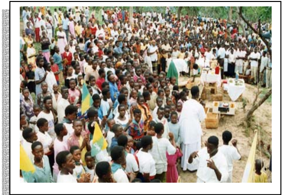
Afrika hat die am schnellsten wachsende Kirche der Welt

Meine Aufgabe im internationalen Entwicklungsbüro der SMA ist es, Wege zu finden, diese Kosten aufzubringen, bis unsere neuen Zweigstellen der SMA Selbstversorger werden.