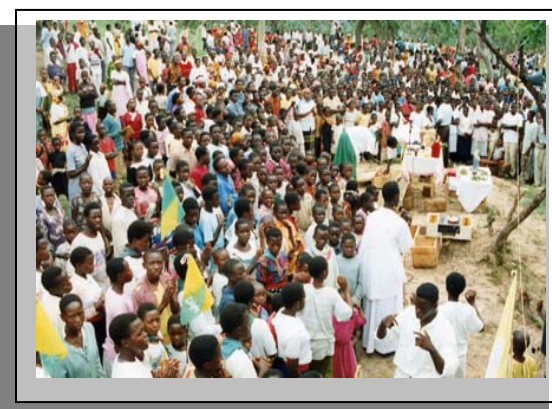
L'Afrique a l'Église qui croît le plus rapidement dans le monde.

Former un étudiant coûte en moyenne 4.000 $ par an. Avec environ 250 étudiants, nous devons trouver 1 million $ chaque année pour cela. Mon travail au Bureau International du Développement SMA est de trouver le moyen de recueillir ces fonds pour aider les nouvelles branches SMA à devenir autosuffisantes.