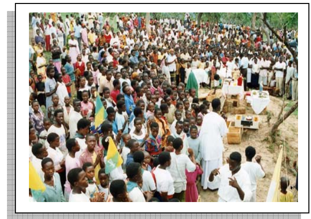
Il-Knisja fl-Afrika l-aktar li qed tikber fid-Dinja.

Trid, bejn wiehed u iehor, $4,000 fis-sena biex tħarreg kull student. Għal xi 250 student irridu nsibu miljun dollaru kull sena għal din il-hidma! Xoghli fl-International Development Office tas-SMA hu li nsib mezz kif niġbor dan l-ammont sakemm il-fergħat godda tas-SMA ikunu awto-suffiċjenti.